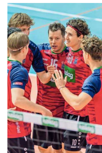
Die Löwen kämpften, verloren in Graz aber knapp

Die Wörther-See-Löwen waren nahe dran an ihrem zweiten Saisonsieg. Bei UVC Graz